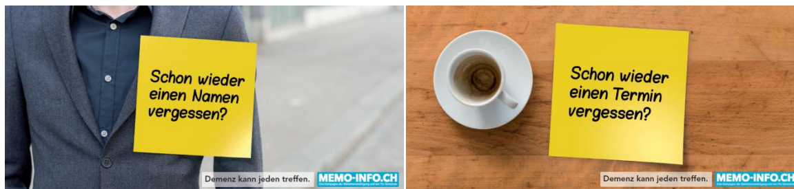
Abbildung zweier Plakatbeispiele aus der Kampagne ‚Demenz kann jeden treffen‘.

Eine zweite Welle der Plakatkampagne ist für Anfang November 2015 geplant. Print- und Onlineinserate werden fortlaufend und regelmäßig geschaltet.